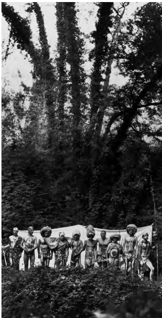
Imatge africana de la tribu furera per a Suz/o/Suz presa en un jardí barceloní