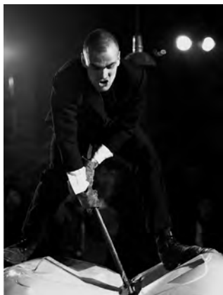
La destrucció del cotxe, emblema d' Accions (1984)

LA FURA DELS BAUS va començar el seu viatge l'any 1979 a Mojà, un poble històric de la Catalunya central, fent teatre de carrer amb un carro i un ase a l'estil dels antics comedians, festius i participatius tot i que amb una bona dosi de subversió. Aviat es van traslladar a Barcelona, oberta i contracultural, i allà un grup de joves professionals s'hi van unir i el grup es va consolidar. Quaranta anys després, La Fura dels Baus és un dels col·lectius emblemàtics de l'escena contemporània internacional.