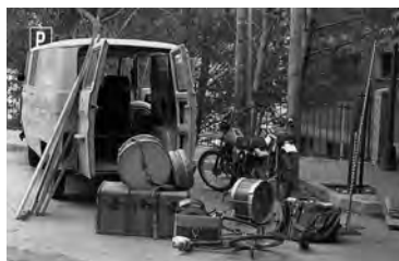
La furgoneta groga